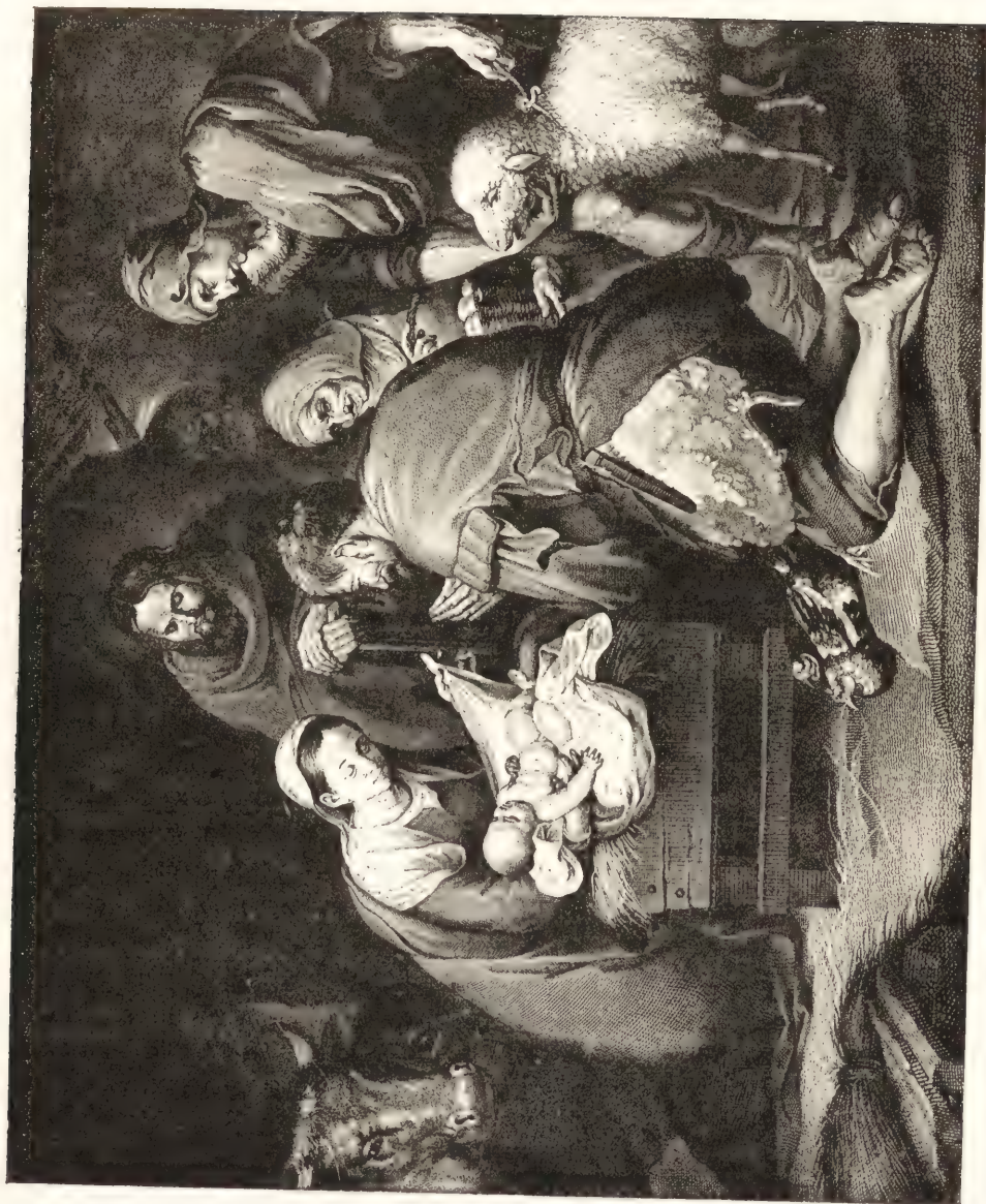
L'ADORATION DES BERGERS. Musée de Madrid.)